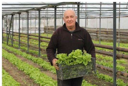
Bild: Kreditnehmer von Georgian Credit

Die Investitionsquote in Mikrofinanzdarlehen und strategische Eigenkapitalbeteiligungen erreichte mit 88,9% des Fondsvolumens den höchsten Wert seit Juli 2016. Die Monatsrendite der Anteilklasse A ist mit 0,35% die höchste seit Fondsaufgabe.