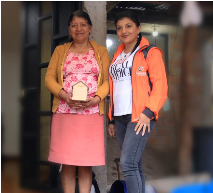
Kundin und Mitarbeiterin von Contactar

Contactar ist ein erfahrenes Mikrofinanzinstitut mit guter Unternehmensführung und ist bereits seit über 30 Jahren im kolumbianischen Markt tätig. Das Mikrofinanzinstitut arbeitet vorrangig mit Mikro-Unternehmer*innen in ländlichen Gebieten zusammen. Weiterhin unterstützt Contactar kleine Geschäfte durch ihren regionalen Ansatz sowie Landwirtschaftsmessen oder auch unterschiedliche Fortbildungen für seine Kund*innen.