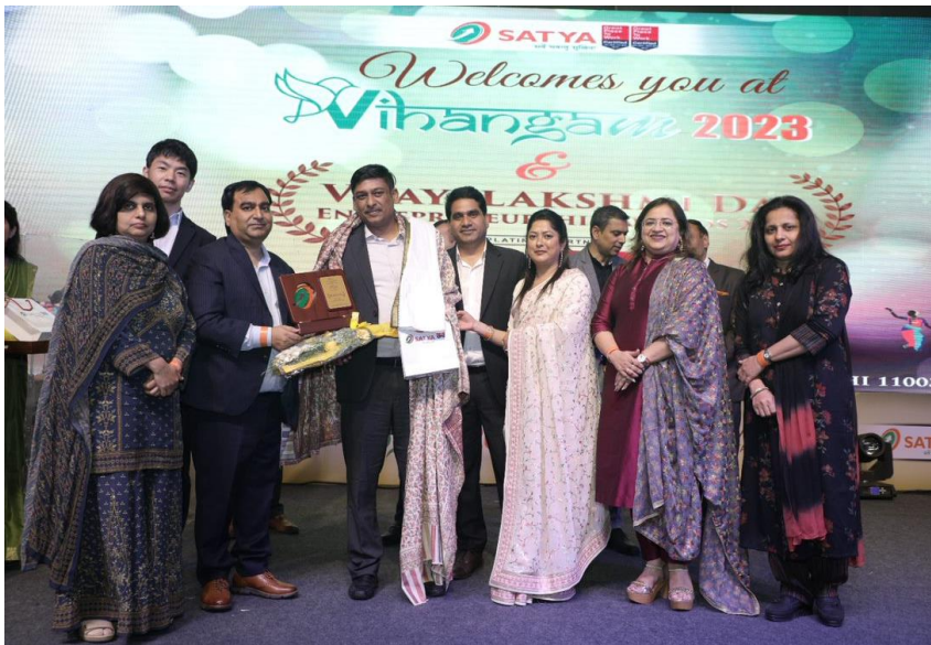
Mitarbeiter*innen von Satya bei der Unternehmerkonferenz Vijayalakshmi

Satya MicroCapital Ltd ist ein registriertes Mikrofinanzinstitut mit Sitz in Dehli, welches erschwingliche Mikrodarlehen vorrangig an Frauen in ländlichen Bereichen in Indien vergibt.