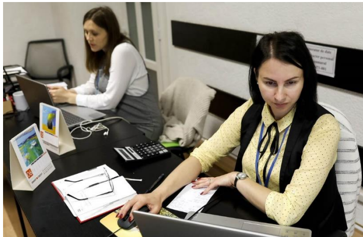
Bild: Mitarbeiterinnen von SMART CREDIT

Das Neugeschäft des GLS AI - Mikrofinanzfonds war mit zwei Krediten bzw. mit rund 1 Mio. EUR neu ausgereichter Kredite im abgelaufenen Monat saisonal bedingt schwächer als in den Vormonaten. Erstmals wurde ein Kredit in die Dominikanische Republik in Lokalwährung ausgereicht. Die Volatilität an den Währungs- und Zinsmärkten bleibt hoch. Es gab Bewertungsänderungen bei Krediten in beide Richtungen, u.a. wurden zwei Kredite in Myanmar niedriger als im Vormonat bewertet.