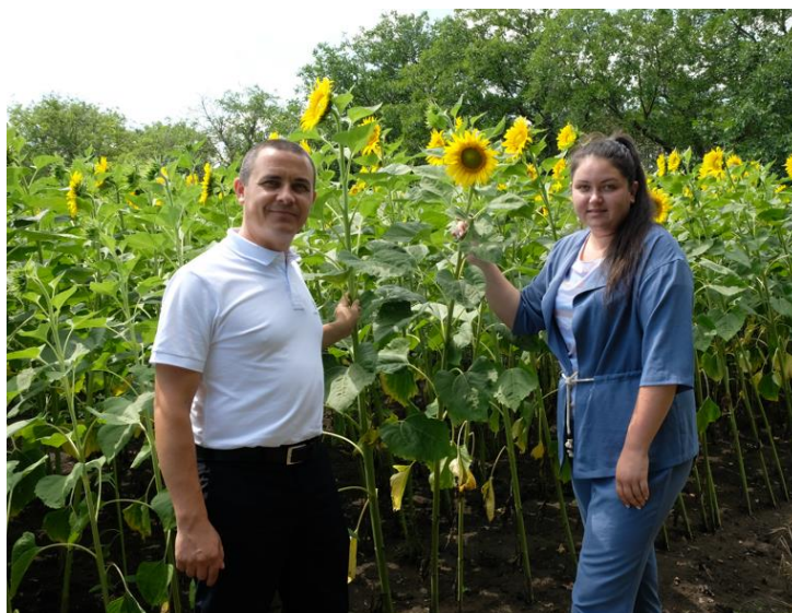
Bild: Kunden von Mikro Kapital Moldova

In den aktuellen Nachrichten zu den Bewegungen am Kapitalmarkt dominieren Inflation und Zinsanstieg die Schlagzeilen. Die EZB dürfte in Kürze die erste Zinsanhebung seit 11 Jahren durchführen, entsprechend hoch sind die Volatilitäten u.a. bei Währungen und im festverzinslichen Bereich. Das Neugeschäft des GLS AI - Mikrofinanzfonds war mit 5 Krediten bzw. mit rund 9,7 Mio. EUR neu ausgereichter Kredite im abgelaufenen Monat rege. Unter den genannten Krediten war der erste Kredit nach Kolumbien in Lokalwährung.