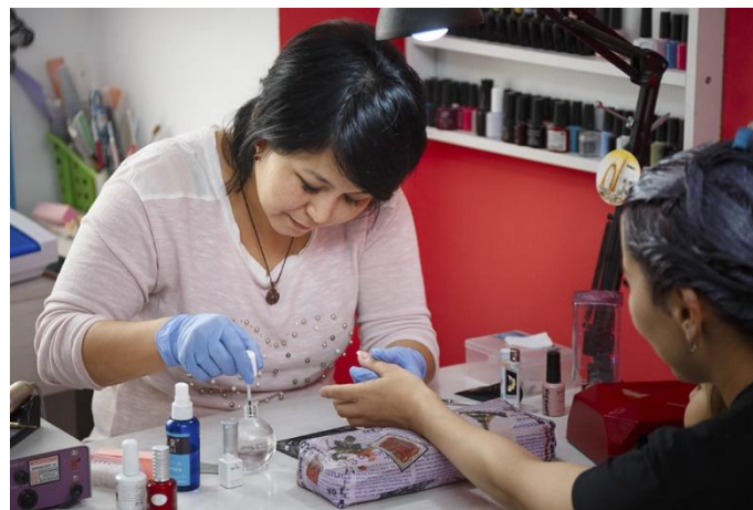
Bild: Kundin von Salyam Finance

Salyam Finance MFC ist als Mikrofinanzinstitut in der gesamten Republik Kirgistan tätig. Es werden Mikrounternehmer*innen sowohl in städtischen, als auch ländlichen Gebieten als Zielgruppe angesprochen. Die Beschränkung auf Mikrofinanz ist nach dem erfolgten Börsengang des Unternehmen nicht verpflichtend, sondern basiert auf der sozial ausgerichteten Unternehmenspolitik mit einer verantwortungsbewussten Kreditvergabe und der Wahrung von Schutzstandards für die Kund*innen. Der GLS AI Mikrofinanzfonds hat im Juni 2021 einen Kredit über 1 Mio. USD an Salyam Finance ausgereicht.