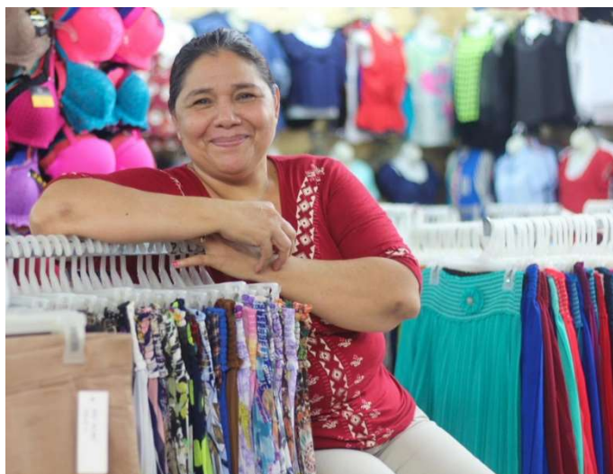
Bild: Kundin von IDH

Der GLS AI Mikrofinanzfonds hat im Oktober erneut einen Kredit an IDH ausgereicht, dieses Mal im Volumen von 2,5 Mio. US-Dollar.