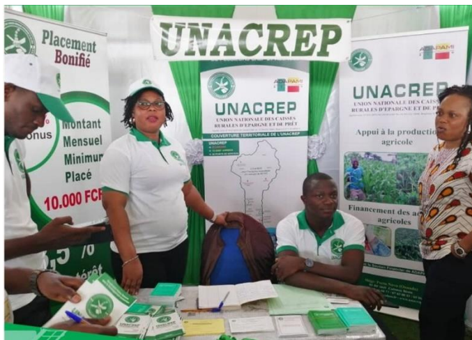
Bild: Werbe- und Informationsstand von UNACREP

Union Nationale des Caisses Rurales d'Épargne et de prêt (UNACREP) ist die Dachorganisation der ländlichen Spar- und Kreditbanken (CREP) in Benin. Die Genossenschaft hat einen starken Fokus auf Solidarität und gegenseitiger Unterstützung und bietet ihren Mitglieder*innen neben Spar- und Kreditprodukte auch Schulungen zu Finanzthemen an. Das Kreditportfolio belief sich per April 2021 auf rund 9 Mio. EUR; davon waren rund 60% für landwirtschaftliche Zwecke vergeben. Der GLS AI-Mikrofinanzfonds hat im September 2021 erstmals einen Kredit an UNACREP über rund 530.000 EUR in Lokalwährung vergeben.