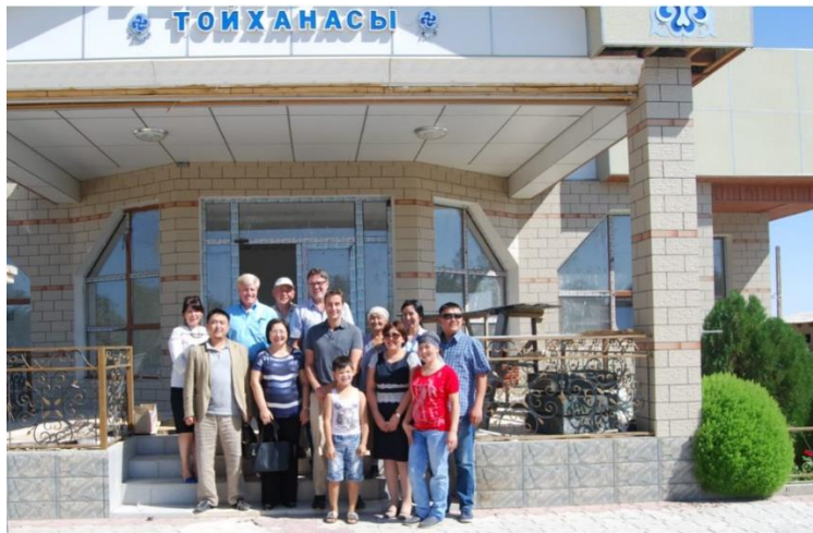
Bild: Angestellte & Familie einer ACF Filiale

Asian Credit Fund (ACF) ist ein Mikrofinanz-Unternehmen, welches sich auf ländliche Haushalte und hier insbesondere auf Frauen in der kleinteiligen Landwirtschaft ausrichtet. Es gibt sowohl individual- als auch Gruppenkredite sowie