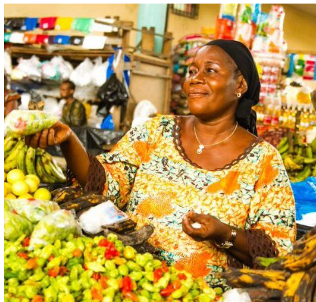
Bild: Kundin von Advans

Gebiete mit einem Unterangebot an Finanzdienstleistungen wie Spareinlagen bzw. Kredit. Sie sind dabei sowohl in städtischen als auch ländlichen Regionen aktiv. Aktuell sind 63 Prozent des Kreditvolumens an Frauen vergeben, 46 Prozent gehen in den ländlichen Raum. Im Dezember 2020 hat der GLS Mikrofinanzfonds einen Kredit über 5 Mio. EUR an die Advans Gruppe ausgereicht.