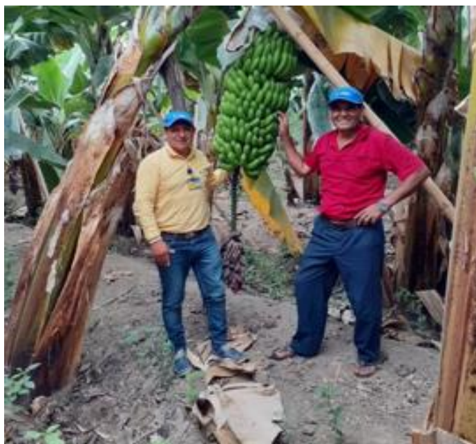
Bild: Kunde und Mitarbeiter von Edpyme

Im Januar wurde ein neuer Kredit vergeben. Das steht im Einklang mit einem saisonal traditionell schwächeren 1. Quartal. Die monatliche Wertentwicklung für die Anteilklasse A beläuft sich auf -0,46 Prozent. Maßgeblich dafür sind wieder Bewertungsschwankungen sowie eine Neubewertung noch bis dahin ausstehender Zahlungsverpflichtungen.