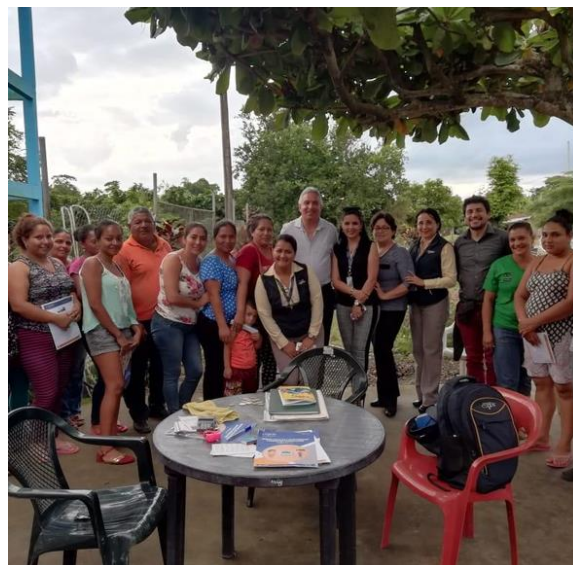
Bild: Financial Training bei ESPOIR

Im Oktober wurde ein bestehender Kredit verlängert. Die monatliche Wertentwicklung für die Anteilklasse A beläuft sich auf -0,32 Prozent. Der Anteilspreis fiel jedoch stärker, weil zudem die jährliche Ausschüttung von 1 EUR für die Anteilklasse A verbucht wurde. Die zum Teil sehr starken Währungsbewegungen im Vorfeld der US-Präsidentenwahl hatten einen leicht negativen Beitrag. Zudem hat sich im Laufe des Oktobers ein Betrugsfall in Indien offenbart, zu dem zum aktuellen Zeitpunkt noch nicht alle Fakten bekannt sind. Eine entsprechende Wertberichtigung wurde bereits vorgenommen und hat die Entwicklung des Anteilspreises belastet. Aktuell ist nicht davon auszugehen, dass der ausgereichte Kredit voll umfänglich zurückbezahlt wird.