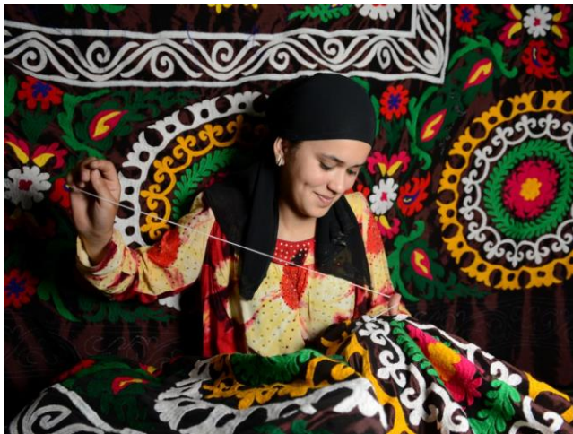
Bild: Kundin der IMON INTERNATIONAL

Die IMON INTERNATIONAL ist ein als internationales Projekt gegründetes Mikrofinanzinstitut (MFI). Es wurde 1999 von der Vereinigung der Geschäftsfrauen Tadjikistans, einer internationalen NGO und der US Agency for International Development (USAID) gegründet. Als eines der größten MFIs in Tadjikistan mit einem Kreditportfolio von rund 97 Mio. US D-Dollar unterstützt es rund 109.000 Kreditnehmer, von denen rund 67% in ländlichen Gebieten tätig sind.