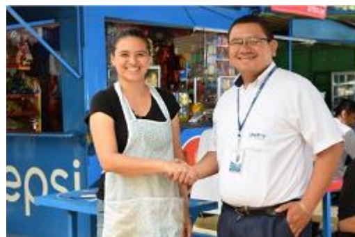
Kleinunternehmerin mit Optima Berater

Insgesamt sind 86,4% des gesamten Fondsvolumens in Mikrofinanzinstituten oder anderen strategischen Investitionen gebunden. Dieser Wert stellt für März die nahezu maximale Investitionsquote dar – zum einen durch die stets zu haltende Liquiditätsreserve, zum anderen, da der Großteil der Zins- und Tilgungszahlungen erst im April für neue Auszahlungen zur Verfügung steht.