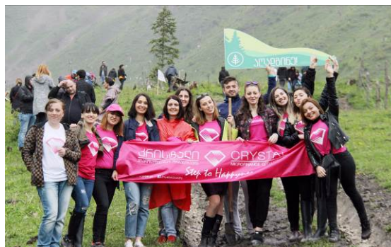
Crystal Mitarbeiter*innen – Baumpflanzaktion in Bordschomi

Der Fonds verzeichnete in den letzten Monaten einen sichtbaren Kursrückgang. Hintergrund ist zum einen die Zwischenausschüttung zum 30.11.2017 sowie die derzeit erhöhten Absicherungskosten aufgrund verstärkter Zinsunterschiede zwischen dem US-Dollar- und Euroraum. Zudem nahm der Fonds im vergangenen Monat vorausschauend eine Wertberichtigung zweier ausstehender Darlehen vor, die sich ebenfalls niederschlägt.