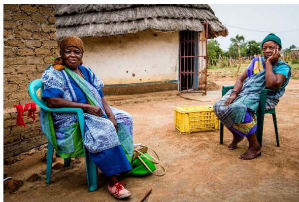
Bild: Kundinnen von SEF

Darüber hinaus bietet SEF neben Krediten auch Sparprodukte sowie Trainings in Finanzangelegenheiten und Gleichberechtigung an. Dies ist ein wesentliches Element, um die 56 Prozent der Bevölkerung zu unterstützen, die unterhalb der nationalen Armutsgrenze liegen.