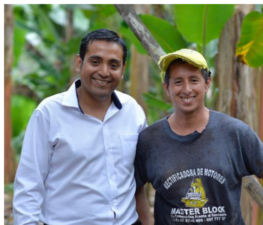
INSOTEC Mitarbeiter mit Plantagenbauer

Der GLS Fonds ist bereits seit Auflage Ende 2015 in Ecuador investiert. Im Dezember 2017 kam mit INSOTEC – dem „Institut für sozioökonomische und technologische Forschung“ das fünfte von mittlerweile sechs Partnerinstituten hinzu. INSOTEC war in den 1970er und 80er Jahren hauptsächlich in der angewandten Forschung aktiv; der Schwerpunkt lag auf Unterstützungsmaßnahmen und Trainingskonzepten für kleine und mittelgroße Unternehmen.